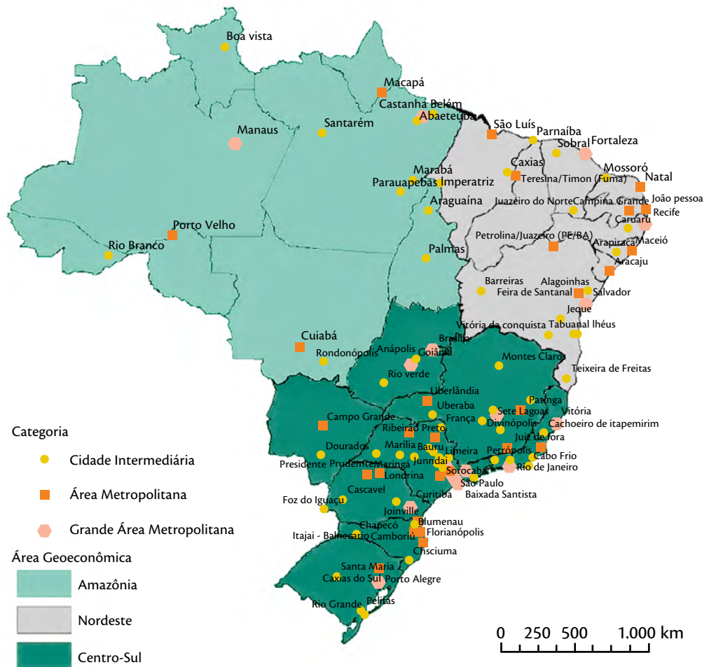
Figura 2 – Cidades-regiões por categoria de tamanho populacional e região geoeconômica (2018)