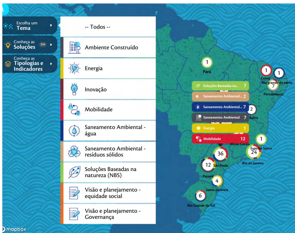
Figura 5 – Tela Inicial SIG WEB OICS, com lista dos temas disponíveis visível

De forma a integrar todas essas informações geradas na construção das tipologias, o Observatório desenvolveu um Sistema de Informação Geográfica, que usa a inteligência territorial para potencializar a exploração, acesso e disponibilização das tipologias, indicadores e dados geobiofísicos de forma interativa e dinâmica. O SIG Web OICS é uma ferramenta potente que disponibiliza aos gestores uma visão estratégica do país, permitindo consultas dinâmicas, integrando as informações das tipologias e soluções que, associadas às características do território, possibilitam ao usuário encontrar as soluções mais adequadas à sua realidade, conforme apresentado nas ilustrações das Figuras 5 e 6.