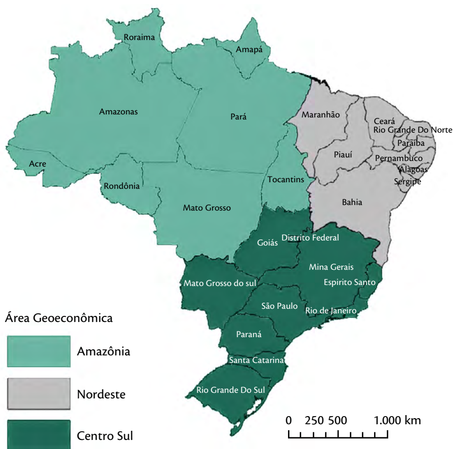
Figura 1 – Regiões geoeconômicas do Brasil

Para a análise da tipologia das cidades-regiões utilizou-se como ponto de partida a divisão do país em regiões geoeconômicas, conforme Geiger (1964), com ajustes para coincidir com os limites das unidades federativas. Essa divisão regional também é adotada pela equipe do Instituto Nacional de Pesquisas Espaciais (Inpe) para o detalhamento dos cenários climáticos para o Brasil (CHOU et al., 2004). Essa divisão territorial também foi utilizada para a seleção das cidades-regiões objeto do estudo do Observatório e deve ser considerada como alicerce para a concepção de tipologias que apreendam a diversidade e a desigualdade entre as regiões brasileiras. A Figura 1 apresenta as regiões geoeconômicas do Brasil.