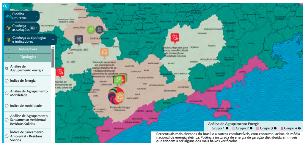
Figura 6 – Representação da tipologia de análise de agrupamento do Tema Energia, com soluções associadas aos diferentes grupos temáticos– SIG WEB OICS